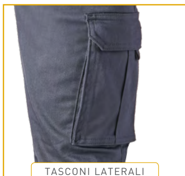
TASCONI LATERALI E POSTERIORI