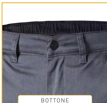
BOTTONE DI CHIUSURA